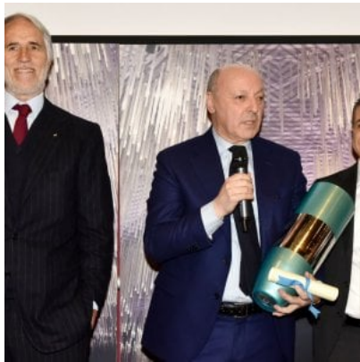
Giuseppe Marotta con Giovanni Malagò