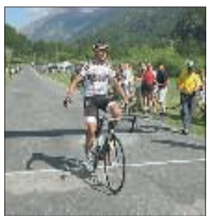
Il traguardo della Ciriè-Piano della Mussa

Nella primavera del 2015 i tecnici di Rcs effettuarono ben due monitoraggi e poi diedero la loro disponibilità per allestire la tappa. Ma, a parte rifare un manto stradale che, in alcuni tratti, ancora oggi è pessimo, occorre circa 150 mila che avrebbero dovuto racimolare degli sponsor. Soldi che non sono mai stati trovati. (gia.gia.)