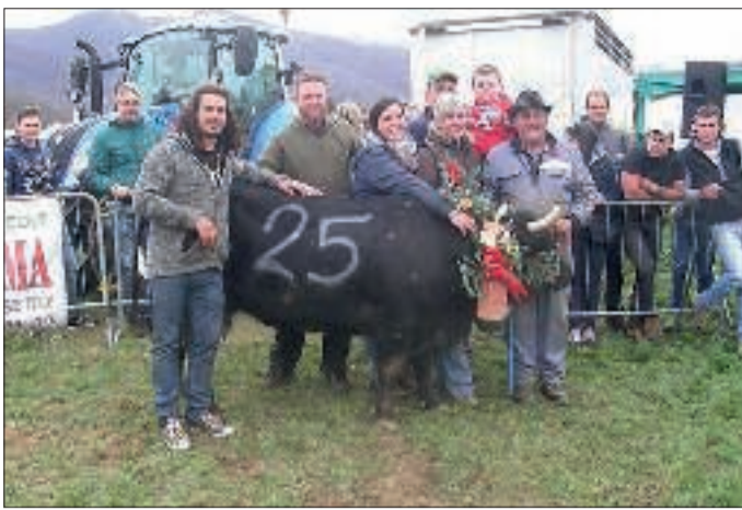
Una bella giornata di tradizione e amicizia