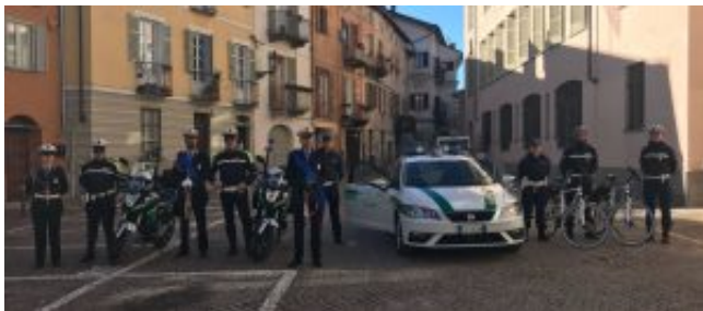
I vigili in piazza Toselli

ponendo le basi per un miglioramento della risposta del servizio alla domanda di sicurezza sempre crescente”.