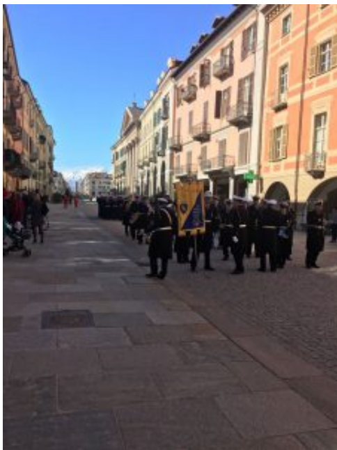
I vigili sfilano in via Roma