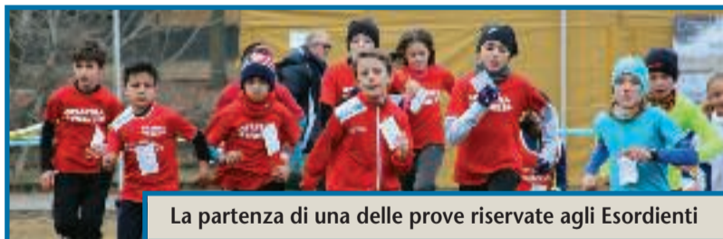
La partenza di una delle prove riservate agli Esordienti