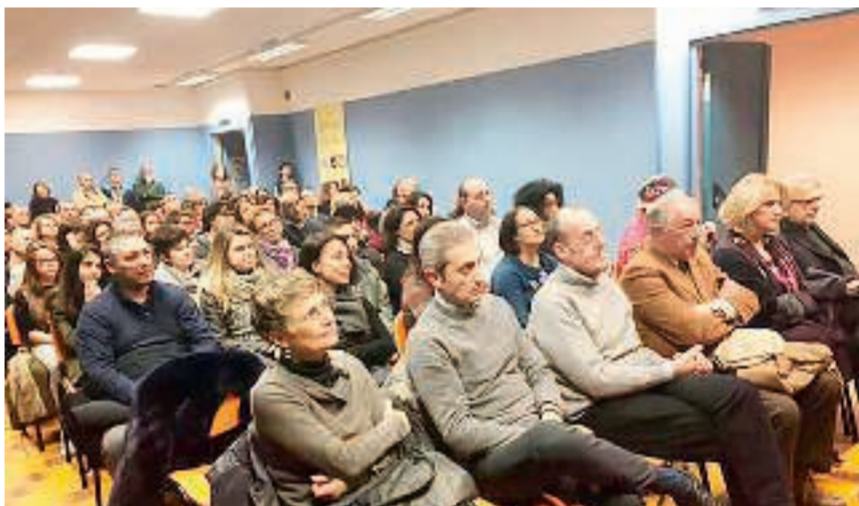
VINOVO - Un momento dell'inaugurazione del rinnovato spazio teatrale.

mento per giovani e adulti fuori ormai dalla scuola. È a disposizione sia delle compagnie amatoriali che di semplici gruppi di amici che insieme vogliono cimentarsi in nuovi percorsi, in progetti di confronto, in momenti di divertimento sano e costruttivo».