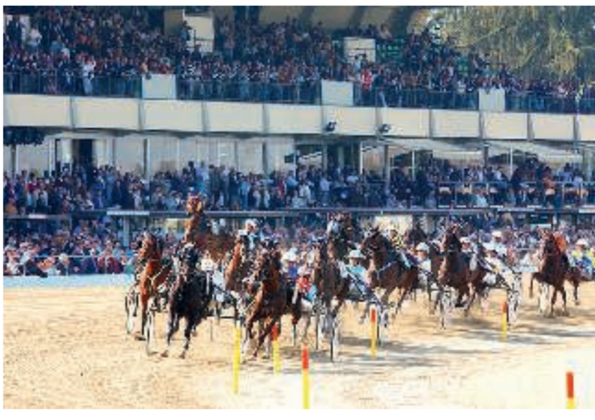
VINOVO - Finché non si risolverà la vicenda sul numero delle corse, momenti come questi rimarranno un ricordo.