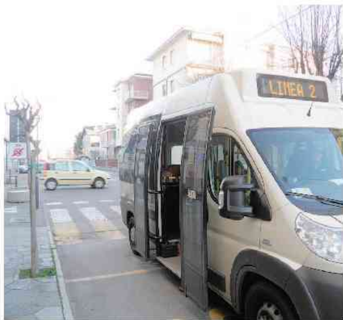
La navetta della linea urbana 2 «rossa»

Nessuna modifica, invece, per la «linea rossa», la seconda navetta che circola i giorni di mercato (martedì e vener-