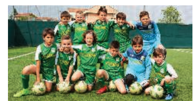
PROTAGONISTI | Pulcini 2008; sotto, i Giovanissimi 2004 Fascia B

L'ultimo fine settimana ha visto impegnate anche le compagini della Scuola Calcio del San Gallo, protagoniste in alcuni tornei. A cominciare da quello organizzato proprio in via Rosa Luxemburg, la Champions League. Nella categoria Pulcini 2007 il San Gallo ha conquistato il primo posto ex aequo con la Strambinese, mentre nella categoria Pulcini misti (2007/08) i biancoverdi si sono accontentati di salire sul