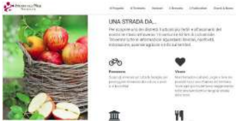
HOME PAGE Il sito si presenta più snello e ricco di contenuti digitali per gli utenti