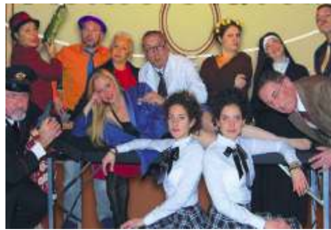
DA TORINO La compagnia teatral Carla S. salirà sul palco nel fine settimana

Ulteriori informazioni sullo spettacolo, e sull'intera rassegna, si possono trovare sul