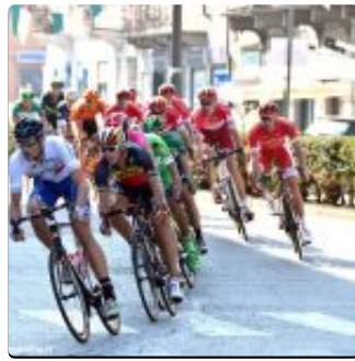
Il Gran Piemonte assegnerà il titolo italiano di ciclismo