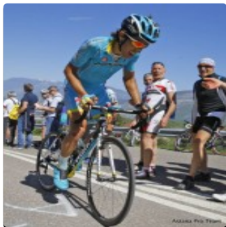
Speciale Giro, La Spezia-Abetone: Rosa sgrana il gruppo dei migliori e lancia Aru