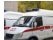
Ennesimo grave incidente in strada Orti a Bra