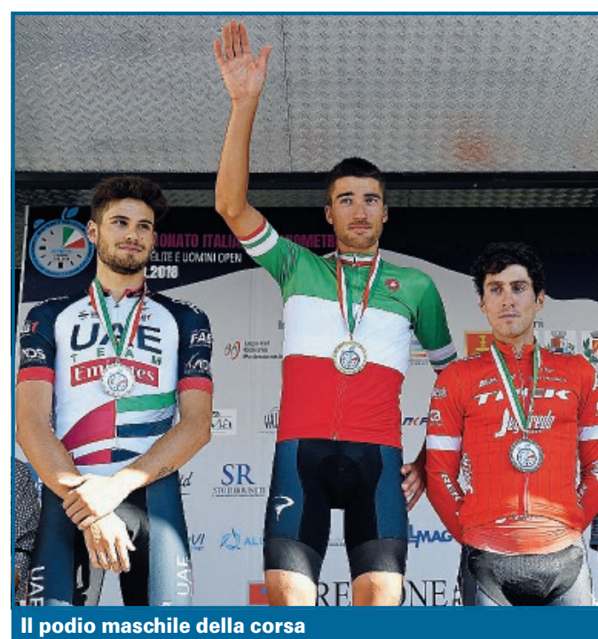
Il podio maschile della corsa

FOOTBALL AMERICANO Il vivaio giallonero schiera tre squadre nell'Under 19, Under 16 e Under 13