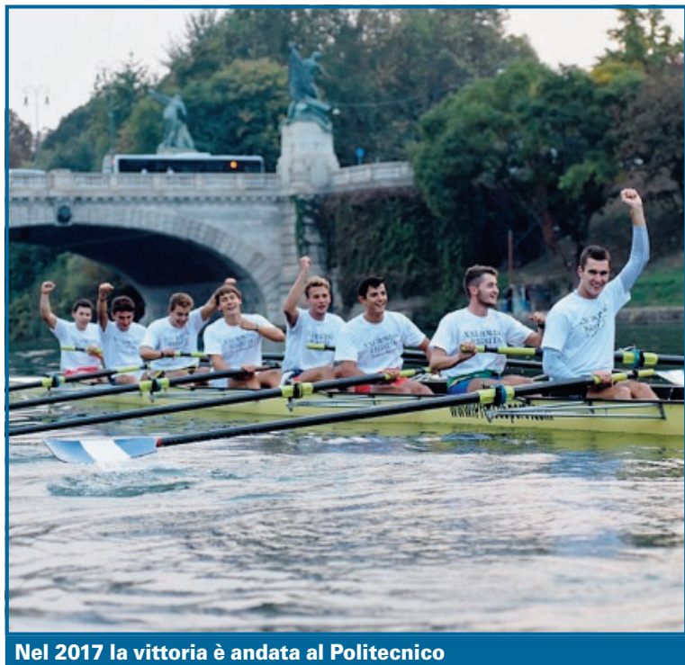
Nel 2017 la vittoria è andata al Politecnico

La manifestazione inizierà alle ore 16,30, con l'Open Day di Dragon Boat ai Murazzi. Alle 17,20 avverrà la benedizione degli equipaggi dei due atenei nel Rettorato dell'Università, in via Po 17. Seguirà alle 17,30 la sfilata lungo via Po per raggiungere i Murazzi. I primi a confrontarsi saranno alle 18,05 i quattro di coppia fem-