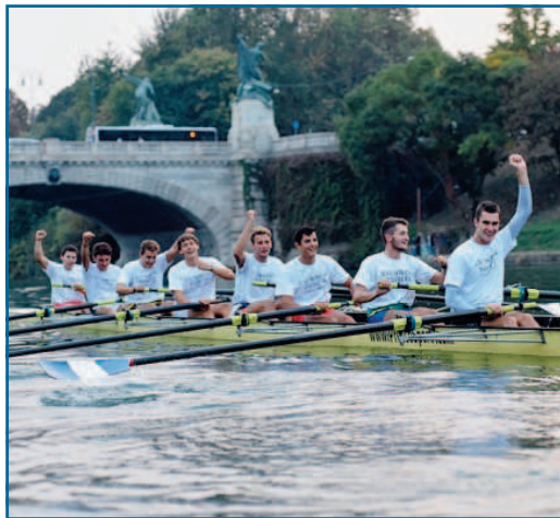
Nel 2017 la vittoria è andata al Politecnico

La manifestazione inizierà alle ore 16,30, con l'Open Day di Dragon Boat ai Murazzi. Alle 17,20 avverrà la benedizione degli equipaggi dei due atenei nel Rettorato dell'Università, in via Po 17. Seguirà alle 17,30 la sfilata lungo via Po per raggiungere i Murazzi. I primi a confrontarsi saranno alle 18,05 i quattro di coppia fem-