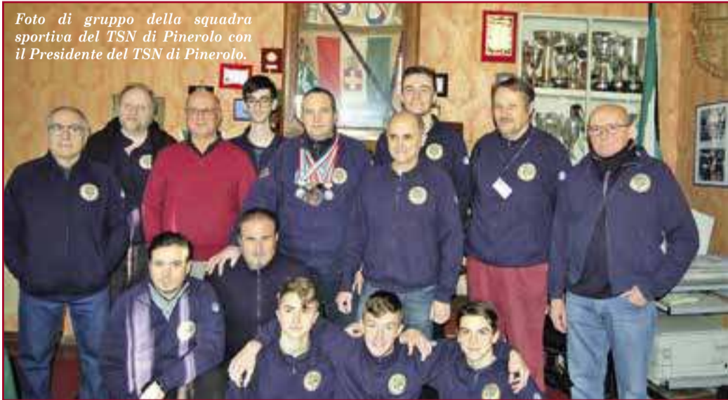
Foto di gruppo della squadra sportiva del TSN di Pinerolo con il Presidente del TSN di Pinerolo.