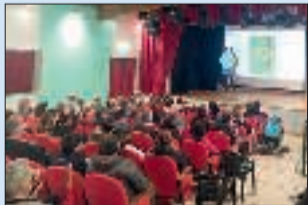
Un momento della proiezione

VIÙ — Sabato 10 novembre, al Teatro della Frazione Bertesseno di Viù, in concomitanza con i festeggiamenti della patronale, è stato proiettato in anteprima il documentario dedicato allo speed down. Sport molto caro ai viucesi la cui storia, che affonda le sue radici nel 1959, è stata ripercorsa attraverso riprese video delle recenti edizioni, filmati d'epoca e interviste a corridori di varie epoche e periodi. Tra gli ospiti, intervenuti sabato scorso c'era anche il campione svizzero Jan Schmid e diversi atleti provenienti da tutta Europa.